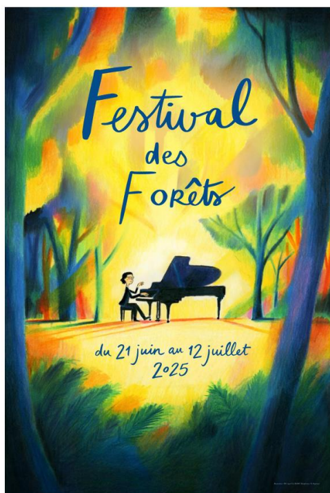
Illustration créée par Pierre-Emmanuel Lyet